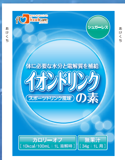
スポーツドリンク風味